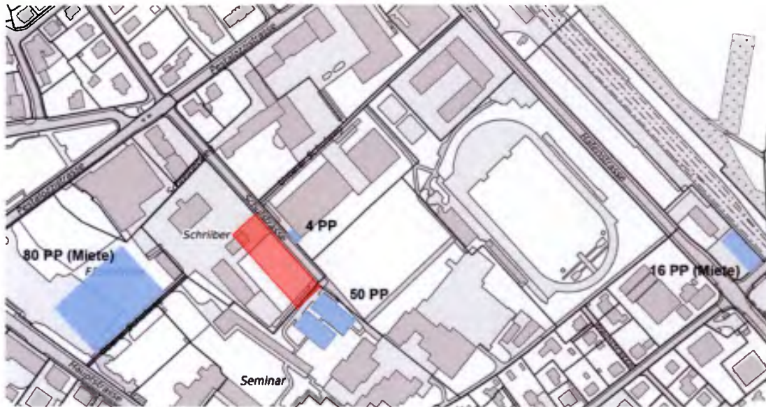
Abb. 1: Standorte der eigenen und angemieteten Parkplätze

Die Rahmenbedingungen für die Realisierung eines Parkhauses oder einer Tiefgarage auf dem Gelände haben sich seit dem Bau des Erweiterungsgebäudes nicht verändert. Die Errichtung eines Parkhauses oder einer Tiefgarage auf dem kantonseigenen Campusareal ist deshalb nicht vorgesehen.